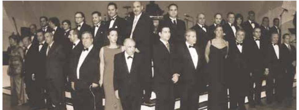
Nouveaux Gouverneurs et Successeurs accueillis lors du Bal des Gouverneurs en 2004

Les Gouverneurs sont invités au cocktail de reconnaissance des donateurs , tenu chaque année à la période des fêtes.