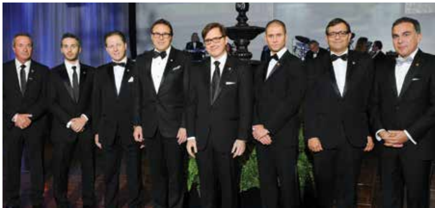
Nouveaux Gouverneurs et Amis accueillis lors du Bal des Gouverneurs en 2013